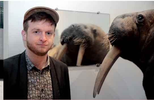
↑ MORSE ATTACKS, OPÉRATION NEPTUNE, SUITE ET FIN de Gilbert Coqalane - rue sainte Catherine

↑ LE TAUREAU de Gé. Pellini Place de la République → FRESQUE STREET ART de KOGAONE 108, boulevard Lobau